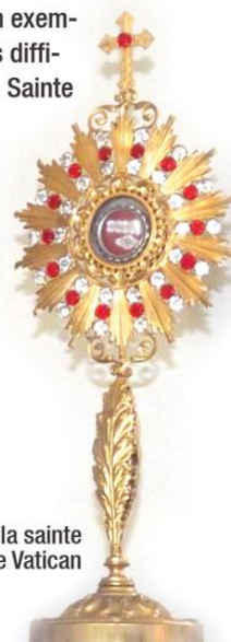
Relique de la sainte authentifiée par le Vatican

Suivez ses traces sur la carte du monde. Découvrez des objets de culte de diverses provenances.